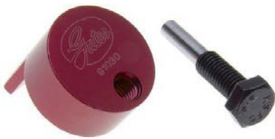
HERRAMIENTA STRETCH FIT® 91030

GATES como fabricante de Equipo Original, conoce a la perfección los versátiles diseño de motor de los vehículos de pasajeros y comerciales de la actualidad. Por ello, es que ofrece la alternativa de profesionalización a técnicos mecánicos instaladores a través de herramientas especializadas y video tutoriales de soporte técnico.