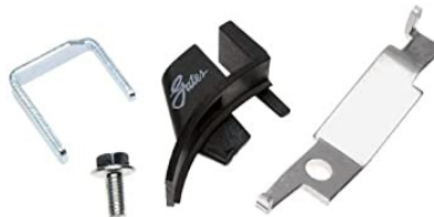
HERRAMIENTA STRETCH FIT® 91031 (SUBARU)