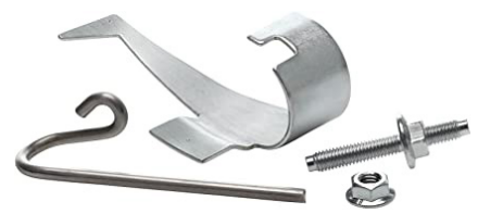
HERRAMIENTA STRETCH FIT® 91032 (FORD)