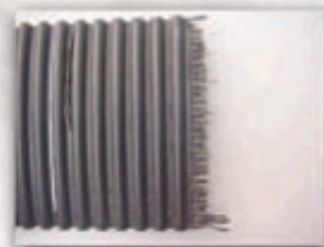
Falla por exceso de tensión