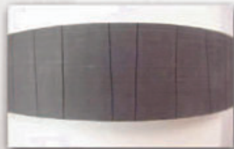
Hule cuarteado por calor excesivo

Las bandas fallan generalmente debido al desprendimiento del diente, y consecuentemente las cuerdas inevitablemente se rompen. Hay bandas especiales para operación en “altas temperaturas”, tales como la Polychain. Estas bandas de poliuretano necesariamente tienen un punto de fusión mayor a 85 °C, pero a menudo los dientes se pueden comenzar a ablandar y deformar; además la cuerda que recibe la adherencia del poliuretano pierde sus características originales.