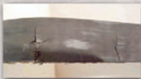
Falla por intromisión de basura

Si una porción de las cuerdas se ha fracturado una vez, la fuerza restante de la banda se reduce considerablemente. Esto da lugar a una disminución dramática de la vida útil de la banda. Los piñones dañados también deben ser substituidos.