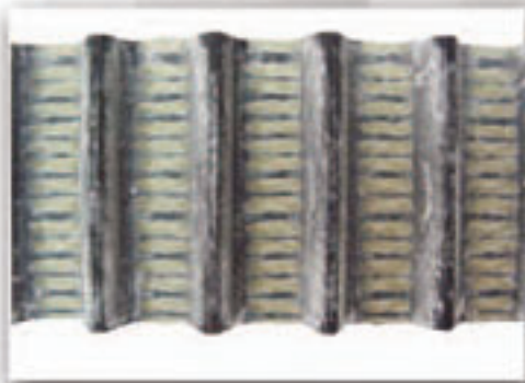
Desgaste por atmósfera abrasiva

Lo peor es que no solo la banda sino que también las poleas dentadas fallan rápidamente en ambientes abrasivos, por lo que es frecuente que los piñones deban substituirse junto con las bandas. Para ampliar la vida útil de las bandas y las poleas dentadas es colocando un protector sellado que evite la intromisión de partículas finas de material; incluso se recomienda presurizar con aire la cubierta sellada que ayude a expulsar hacia fuera el polvo abrasivo y contaminantes.