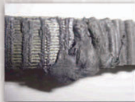
Banda Polychain GT con falla por exceso de calor