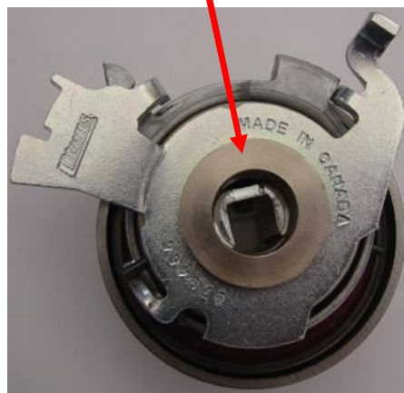
TPG-14004 Ref. EO = 24426500

Gates de México S.A. de C.V., Cda. de Galeana # 5, Fracc. Ind. La Loma, Tlanepantla, Edo. de México, C.P. 54060 Tel. 20 00 27 00, 20 00 27 83, Fax: 20 00 27 01