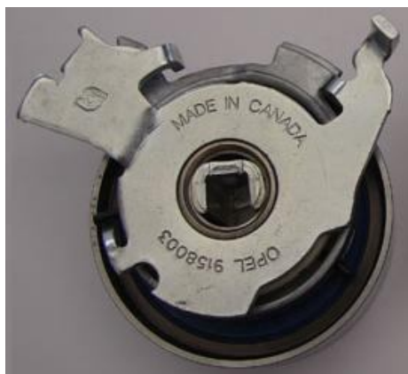
TPG-14001 Ref. EO = 9158003